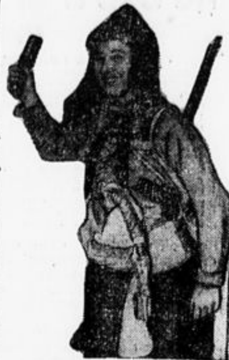
В боевом снаряжении.