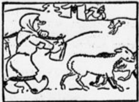
Она свободною рукой Овечек гонит пред собой.