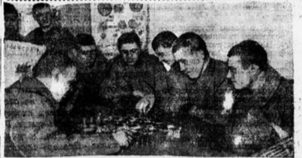
В красном уголке казармы.

Деньги пересылать и направлять в редакцию газеты «Пионерская Правда».