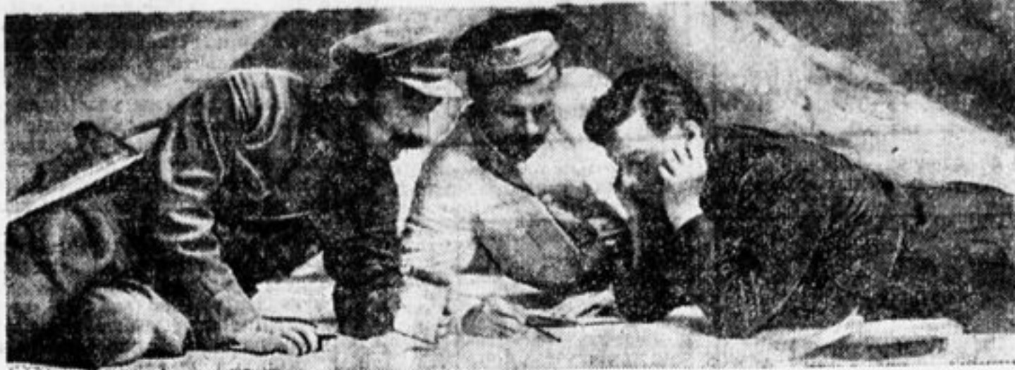
Тт. Буденный, Фрунзе и Ворошилов.

«Наш красноармеец — не прежний царский солдат, затыканный и запуганный, чья роль сводилась к простой машине в руках начальства. Наш красноармеец — полноценный гражданин республики» (Фрунзе).