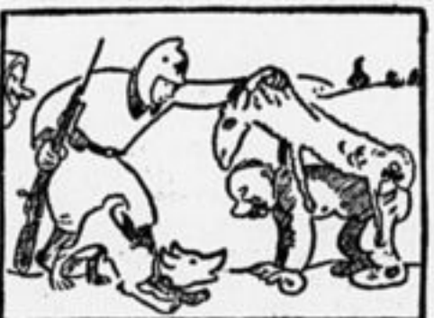
Эх-ма! А шкура-то овечья Натянута на чьи-то плечи.