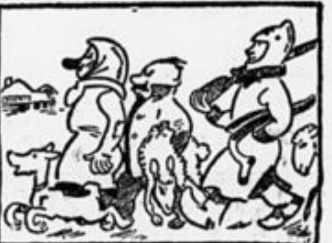
Ну, что-ж, гражданочка, пой- дем! В отряде все мы разберем.