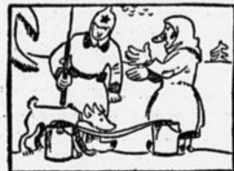
Щенок полнехонек тревог: «Оно ведь пахнет, как чулок!»