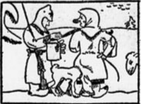
Гляди: ка: на плечах повисло... Простое с виду коромысло...