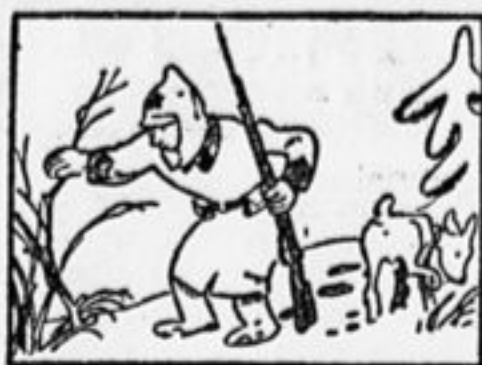
На подозренье—каждый хруст, Порой здесь дышит даже куст.