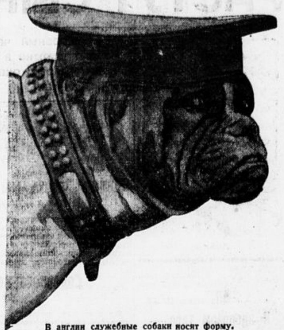
В англии служебные собаки носят форму.