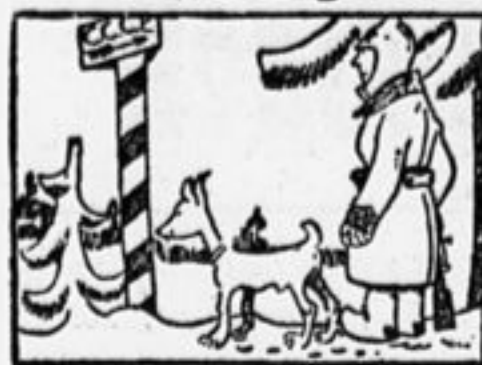
Хоть на границе не пестро, Но ухо здесь держи остро.