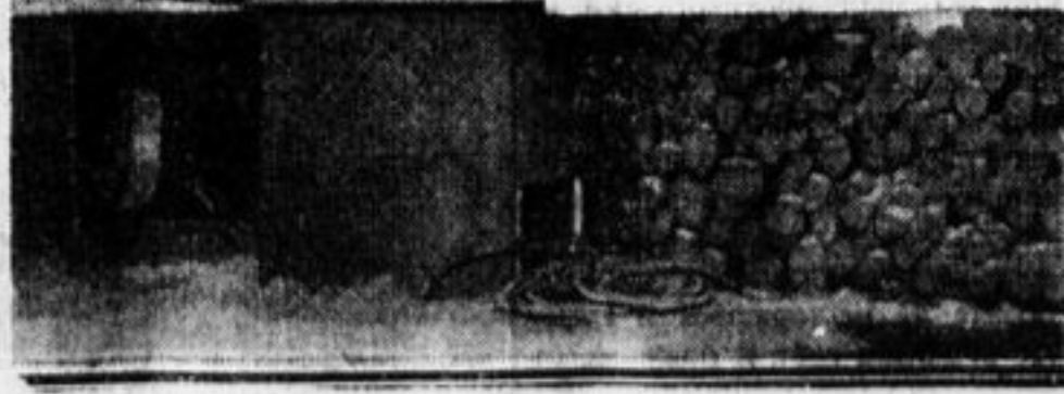
Вверху: запись рабочих в первые отряды красной гвардии. Внизу: баррикады на улицах Ленинграда.

Мы создали армию, которая первый раз в истории знает, за что она борется