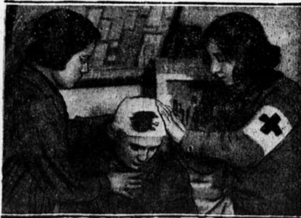
Санитарный кружок 53-го отр. Кр. Пресни.