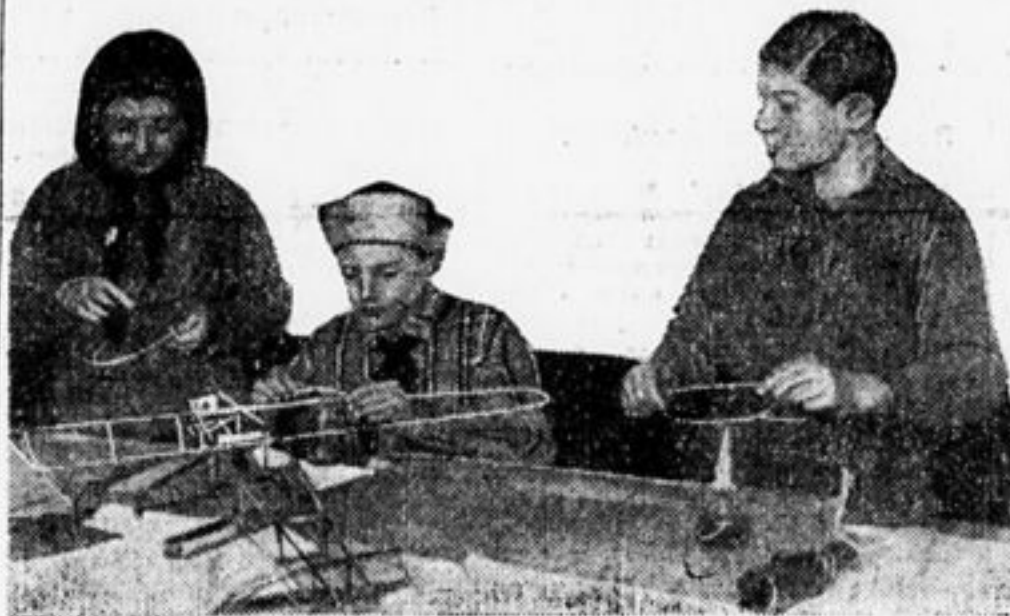
Кружок моделистов за работой.