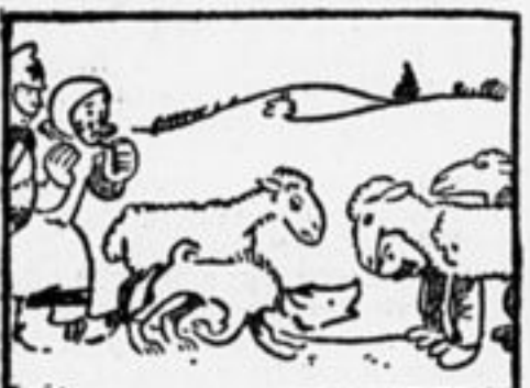
Подавлен песик чудесами: «Страсть от овцы несет ду- хами»...