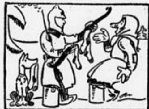
А в коромысле-то внутри Чулочков будет дюжины три...