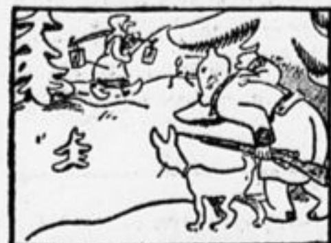
Щенок бежит по воле нюха... Идет по воду молодуха.