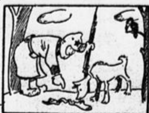
Но контрабанду песик Мак По нюху узнавать мастак.