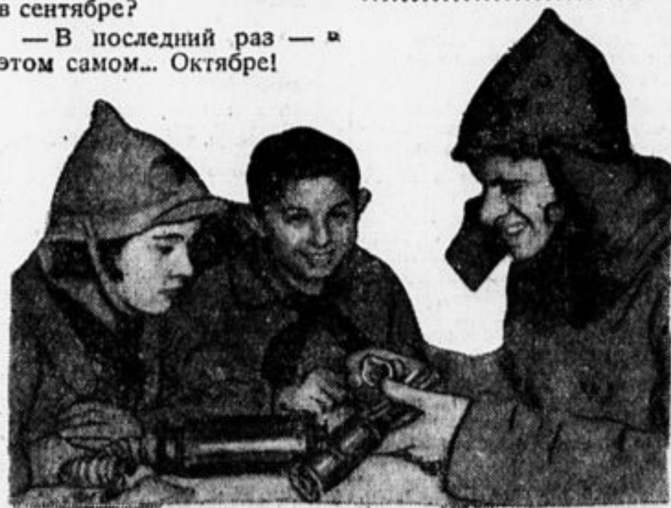
Занятия военного кружка.

Отв. редактор: В. Лядова. Издатель: И-во «Правда» и «Беднота».