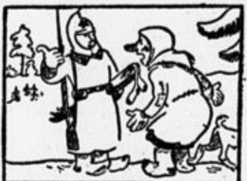
— Здесь три десятка пар всего— Для потребленья своего!..